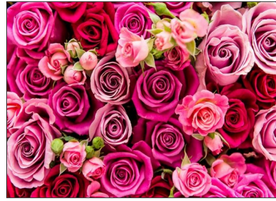
Día de la madre (mayo)