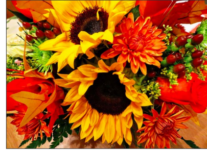
Día de Acción de gracias (noviembre)