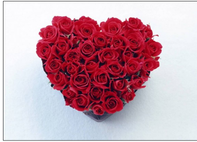
San Valentín (14 de febrero)